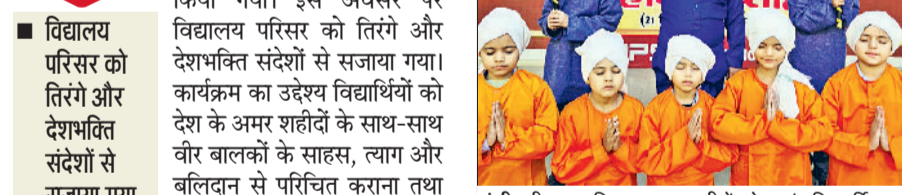
हांसी। वीर बाल दिवस पर बाल वीरों को श्रद्धांजलि अर्पित करते नहे मुने बच्चे।

हांसी। आरपीएस पब्लिक स्कूल में शुक्रवार को सफर-ए-शहादत कार्यक्रम के अंतर्गत शहीदी दिवस एवं वीर बाल दिवस का श्रद्धा, सम्मान और देशभक्ति के वातावरण में कार्यक्रम का आयोजन किया गया। इस अवसर पर विद्यालय परिसर को तिरंगे और देशभक्ति संदेशों से सजाया गया। कार्यक्रम का उद्देश्य विद्यार्थियों को देश के अमर शहीदों के साथ-साथ वीर बालकों के साहस, त्याग और बलिदान से परिचित कराना तथा उनमें राष्ट्रप्रेम की भावना को सुदृढ़ करना रहा। कार्यक्रम में नर्सरी से दूसरी कक्षा तक के विद्यार्थियों ने भाग लिया और अपने देशभक्ति गीत, समूह नृत्य, कविता पाठ और लघु नाटिकाओं के माध्यम से शहीदों एवं बाल वीरों को श्रद्धांजलि अर्पित की। कार्यक्रम के दौरान विद्यालय परिसर में शहीदों और बाल वीरों की वीरगाथाओं को दर्शाती आकर्षक झांकियां भी निकाली गईं, जो सभी के लिए आकर्षण का केंद्र रही।