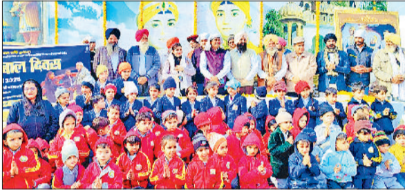
टोहाना। वीर बाल गेट टोहाना पर साहिबजादों के बलिदान को नमन करते बच्चे।