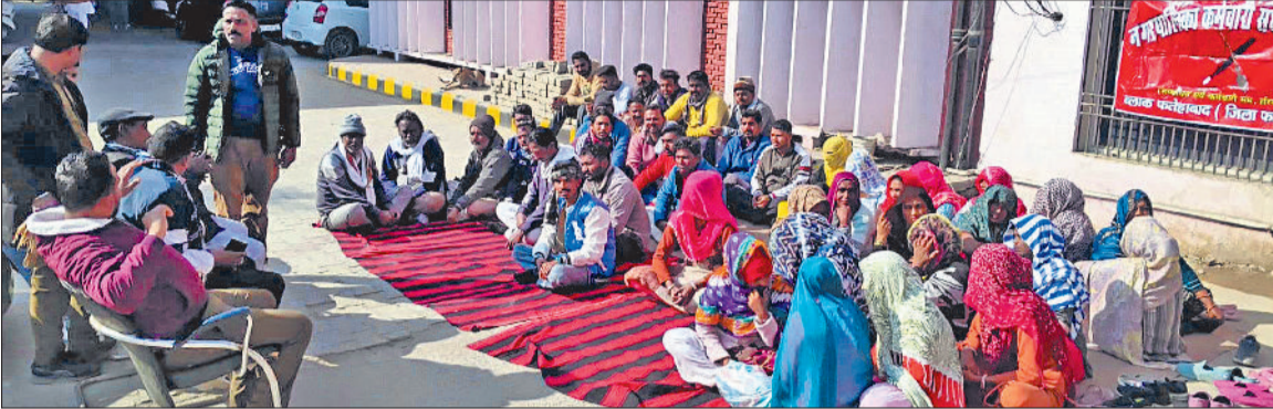
फतेहाबाद। नगरपरिषद कार्यालय में धरना देते सफाई कर्मचारी।

नगरपालिका कर्मचारी संघ के बैनर तले आंदोलन शुरू कर दिया है। सफाई कर्मचारी आज नगरपरिषद प्रांगण में धरने पर बैठे और सरकार व नगरपरिषद प्रशासन के खिलाफ जमकर नारेबाजी की।