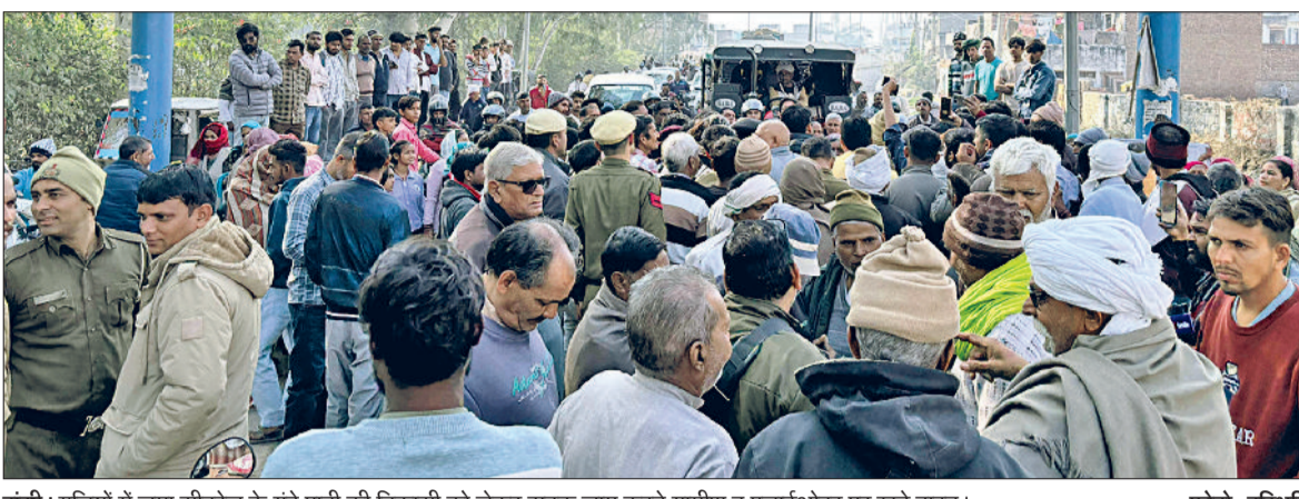
हांसी। गलियों में जमा सीवरेज के गंदे पानी की निकासी को लेकर सड़क जाम करते ग्रामीण व फ्लाईओवर पर खड़े वाहन।

हरिभूमि न्यूज ॥ हांसी उमरा रोड स्थित प्रेमनगर गांव के लोगों ने शुक्रवार दोपहर गलियों में जमा सीवरेज के गंदे पानी तथा सीवरेज का पानी मिक्स होकर आ रही पेयजल सप्लाई की समस्या को दुरुस्त करने की मांग फ्लाईओवर पर जाम लगा दिया। ग्रामीणों ने प्रशासन व जनस्वास्थ्य विभाग के खिलाफ प्रदर्शन करते हुए जमकर नारेबाजी की। लोगों द्वारा उमरा रोड फ्लाईओवर पर जाम लगाए जाने के चलते सड़क के दोनों ओर वाहनों की लंबी लंबी लाइनें लग गई जिसके चलते राहगीरों को काफी परेशानियों का सामना करना पड़ा।