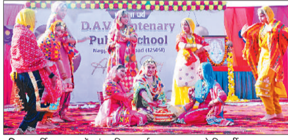
रतिया। वार्षिक उत्सव में सांस्कृतिक कार्यक्रम प्रस्तुत करते विद्यार्थी।