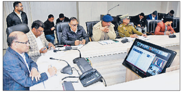
फतेहाबाद। अधिकारियों की समीक्षा बैठक को संबोधित करते डीसी।