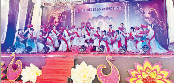
फतेहाबाद। क्रेसंट स्कूल में आयोजित कार्यक्रम में प्रस्तुति देते विद्यार्थी।

पालन हारे जैसे भक्ति गीतों ने सभी को आध्यात्मिक अनुभूति से जोड़ दिया। यज्ञ सीन एवम रामा रामा रतते भजन ने यह संदेश दिया कि हमारी परंपराएं आज भी उतनी ही जीवंत एवं प्रेरणादायक हैं। कार्यक्रम के