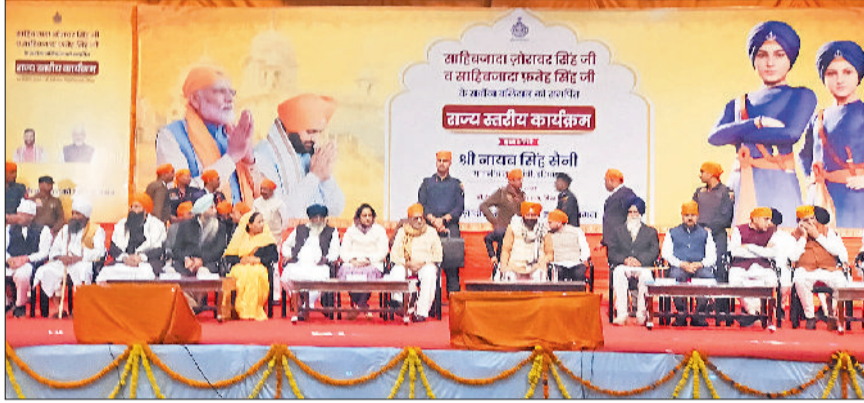
सिरसा। वीर बाल दिवस पर आयोजित राज्य स्तरीय समारोह में भाग लेते सीएम तथा विजेता विद्यार्थियों को सम्मानित करते हुए।