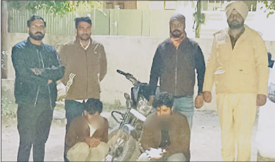
सिरसा। अफीम के साथ पकड़े गए आरोपी पुलिस की गिरफ्तार में।

क्रेसंट स्कूल में आयोजित 'द सेक्रेड सागा मिथिक फिएस्टा' केवल एक सांस्कृतिक कार्यक्रम नहीं था, बल्कि नन्हे-मुन्हे विद्यार्थियों की मासूम प्रस्तुतियों, भारतीय संस्कृति, भक्ति एवं पौराणिक गाथाओं को सजीव रूप था। कार्यक्रम का शुभारंभ कक्षा छठी के विद्यार्थियों द्वारा की गई सरस्वती वंदना से हुआ। नन्हे स्वरो की गूंज से पूरा सभागार श्रद्धा एवं शांति से भर उठा। जन्म सीन, शैतान नृत्य, काल भैरव नृत्य, धरती नृत्य, देवी-देवता एवं वराह अवतार जैसी प्रस्तुतियों ने दर्शकों के मन को भाव-विभोर कर दिया। विष्णु भगत-जग