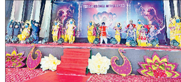
संस्कृति बोलती, बच्चों का मंच

पालन हारे जैसे भक्ति गीतों ने सभी को आध्यात्मिक अनुभूति से जोड़ दिया। यज्ञ सीन एवम रामा रामा रतते भजन ने यह संदेश दिया कि हमारी परंपराएं आज भी उतनी ही जीवंत एवं प्रेरणादायक हैं। कार्यक्रम के