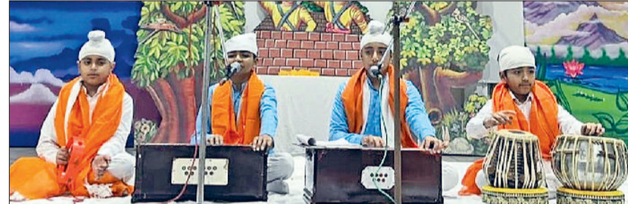
हांसी। वीर बाल दिवस पर सांस्कृतिक कार्यक्रम प्रस्तुत करती स्कूली बच्चे।

हरिभूमि न्यूज ॥ हांसी बाबा बंदा बहादुर पब्लिक स्कूल में शुक्रवार को गुरु गोविंद सिंह जी के चारों साहिबजादों की शौर्य गाथा को समर्पित वीर बाल दिवस के उपलक्ष्य में 20 से 26 दिसंबर तक शहीदी सप्ताह के रूप में श्रद्धापूर्वक मनाया गया। इस अवसर पर विद्यालय प्रांगण में विशेष कार्यक्रमों का आयोजन किया गया जिसमें विद्यार्थियों ने चारों साहिबजादों बाबा अजीत सिंह, बाबा जुझार सिंह, बाबा जोरावर सिंह व बाबा फतेह सिंह के